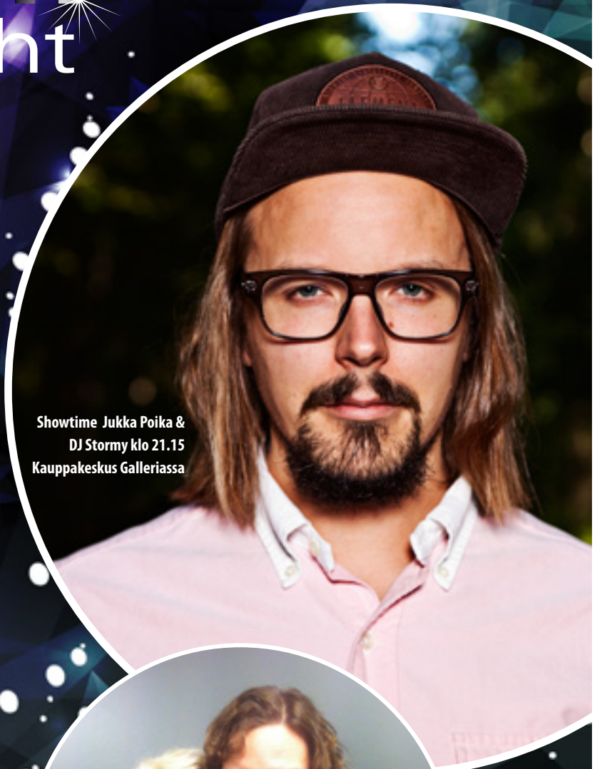
Showtime Jukka Poika & DJ Stormy klo 21.15 Kauppakeskus Galleriassa