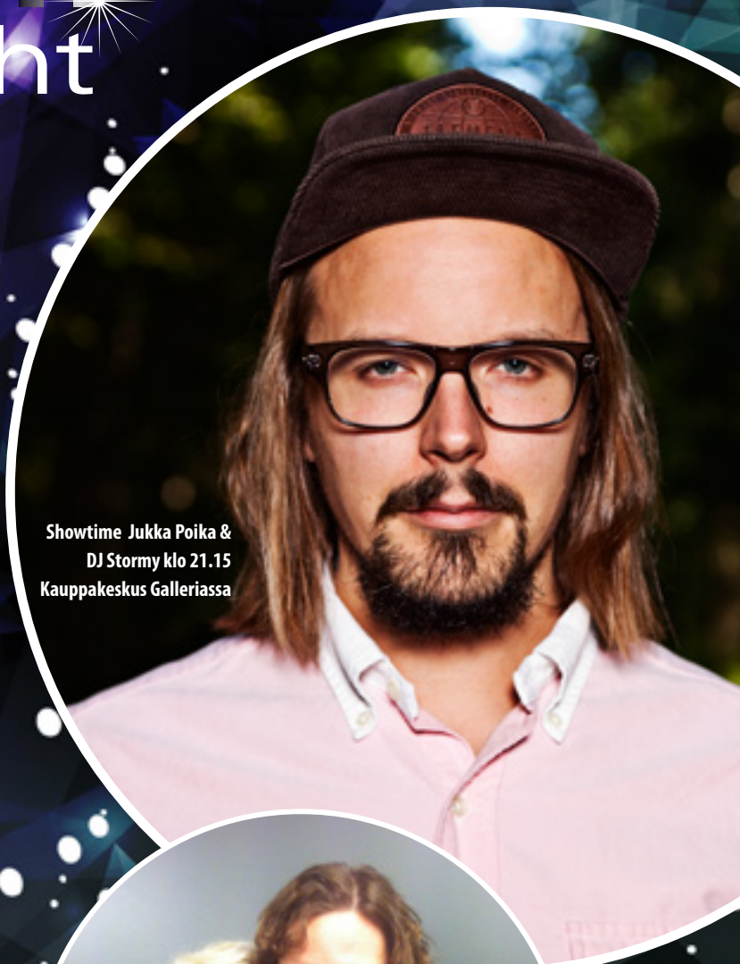
Showtime Jukka Poika & DJ Stormy klo 21.15 Kauppakeskus Galleriassa